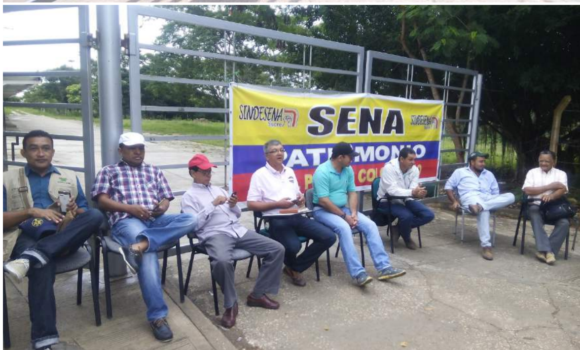
PLANTÓN DE LOS APRENDICES EN LA SEDE AGROINDUSTRIAL – LA GALLERA SENA SUCRE –SEDE COMERCIO Y SERVICIOS (SEDE BOSTON).