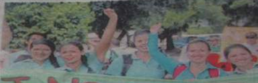
La comunidad estudiantil sería la principal afectada.

Líderes sindicales y estudiantes del Sena marcharon ayer en apoyo al paro nacional que hace dos semanas viene adelantando el Servicio Nacional de Aprendizaje, Sena, en contra de la reforma tributaria la cual consideran lesiva para la institución dado que redu-