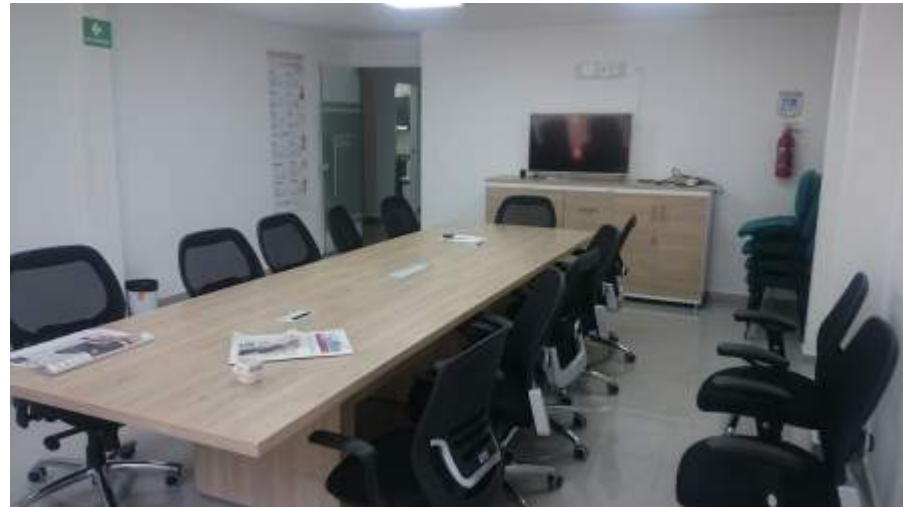
SALA DE JUNTAS

En tema de bienestar se cuenta con un cafetín, baterías sanitarias, bodega, archivo y sala de juntas completamente equipadas y confortables