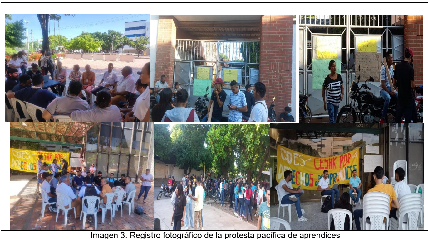
Imagen 3. Registro fotográfico de la protesta pacífica de aprendices