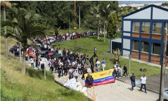
Saloneos en el Centro Pecuario y Agroempresarial de La Dorada